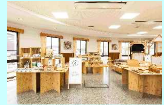
奥大和移住定住交流センター「engawa」