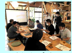
クリエイティブスクール